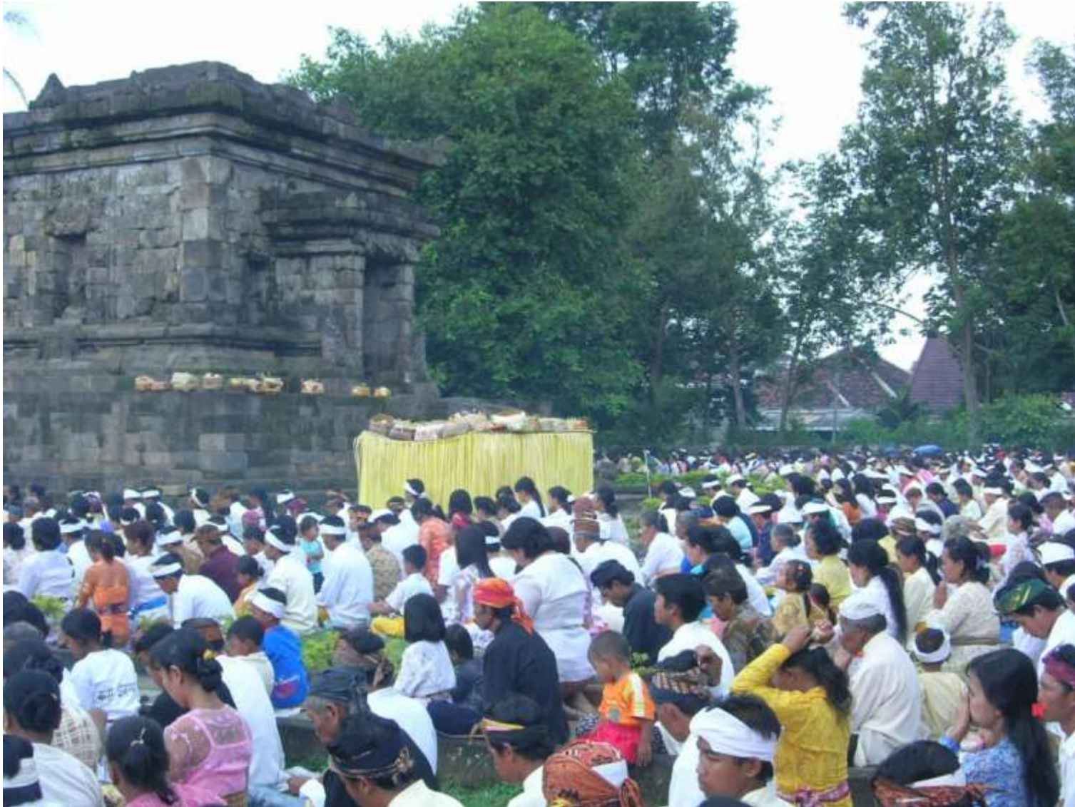
NYEPI, CANDI BADUT