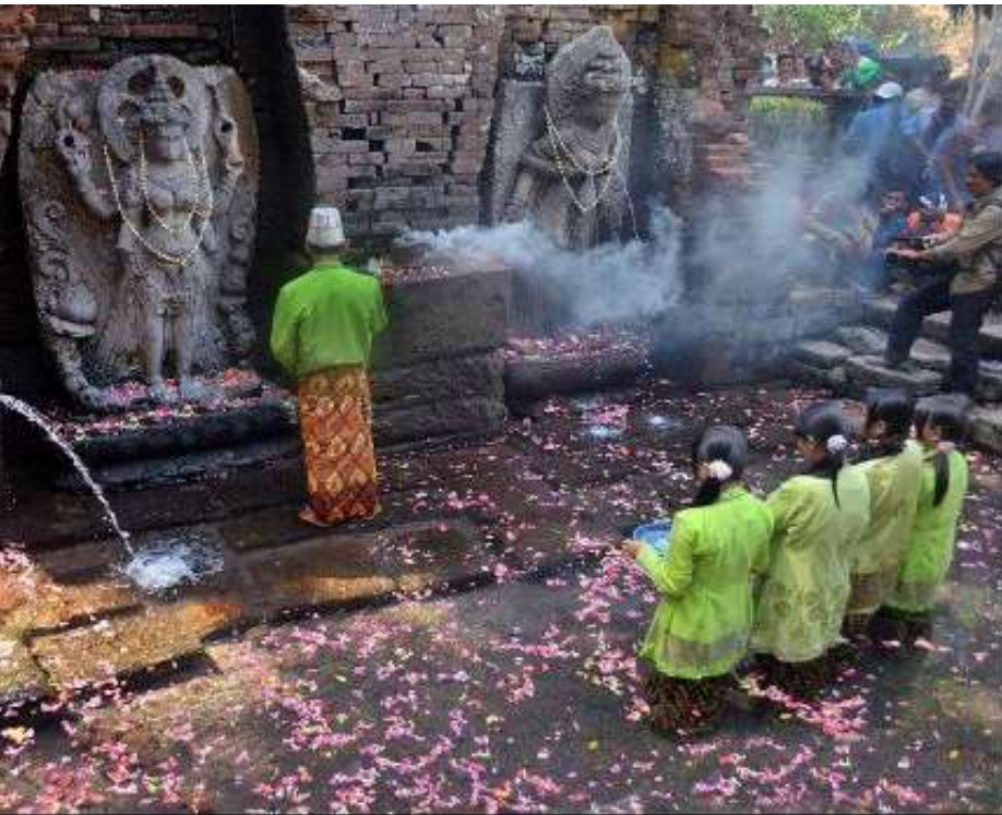
RUWATAN DI CANDI BELAHAN, JATIM