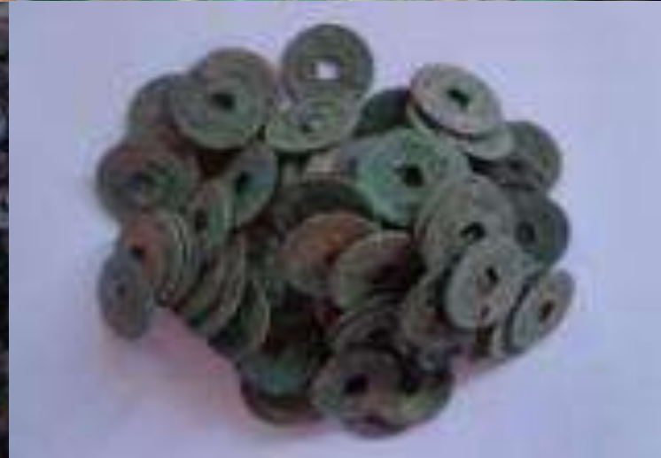
Peninjauan temuan mata uang logam di Desa Kuningan Kecamatan Kanigoro Kabupaten Blitar