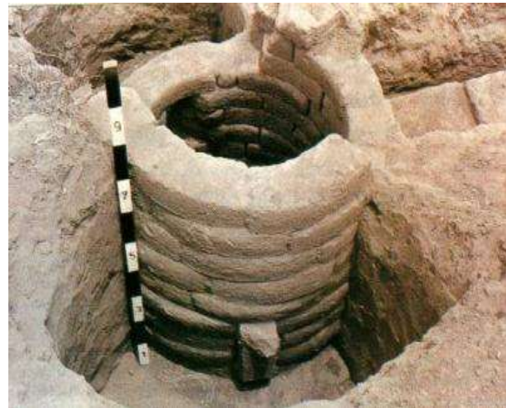
Struktur sumur kuno di Trowulan