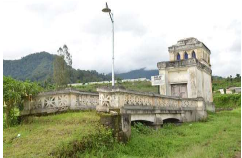
Bangunan kolonial di kota batu