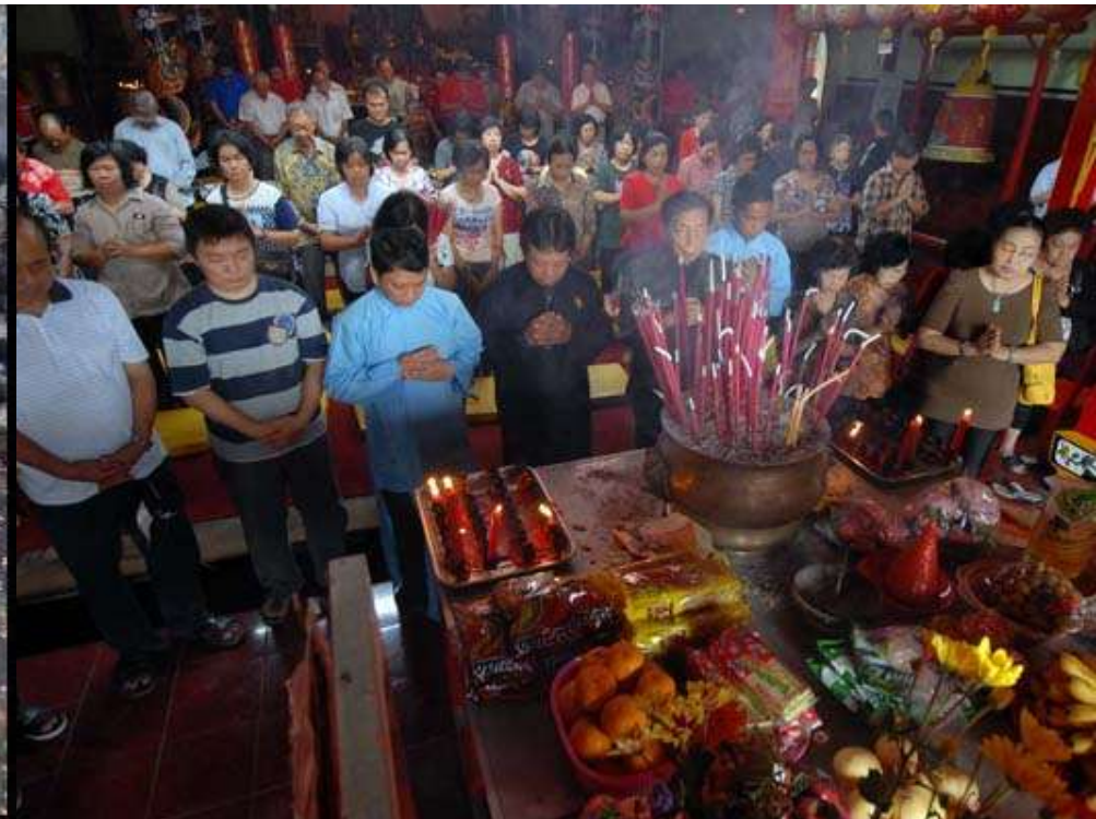
IMLEK DI KLENTENG PONCOWINATAN YOGYAKARTA