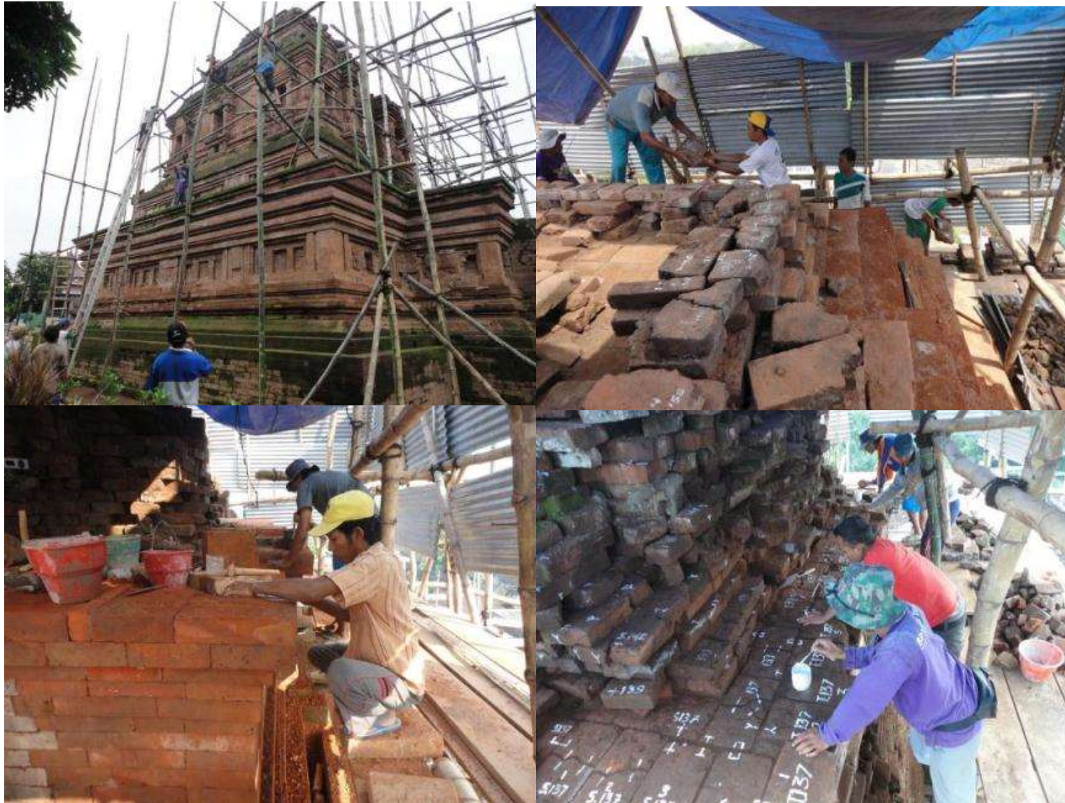
Pemugaran Cagar Budaya di Candi Gunung Gangsir Kabupaten Pasuruan