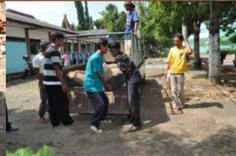
Pemindahan Benda Cagar Budaya Di Kabupaten Jember