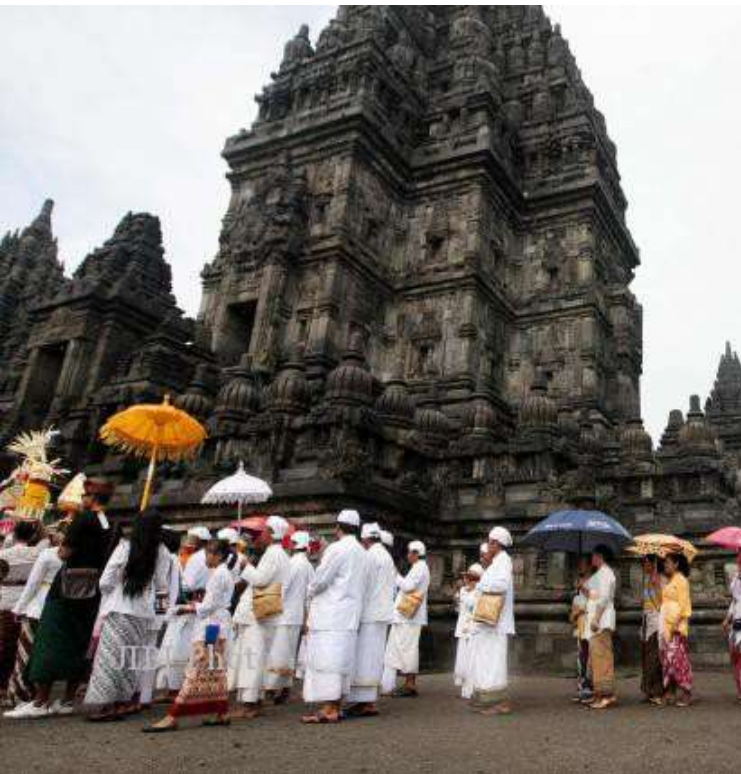
NYEPI UMAT HINDU DI CANDI PRAMBANAN