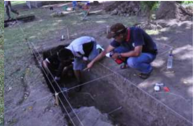
Ekskavasi Rumah dinas Balai Kota Surabaya