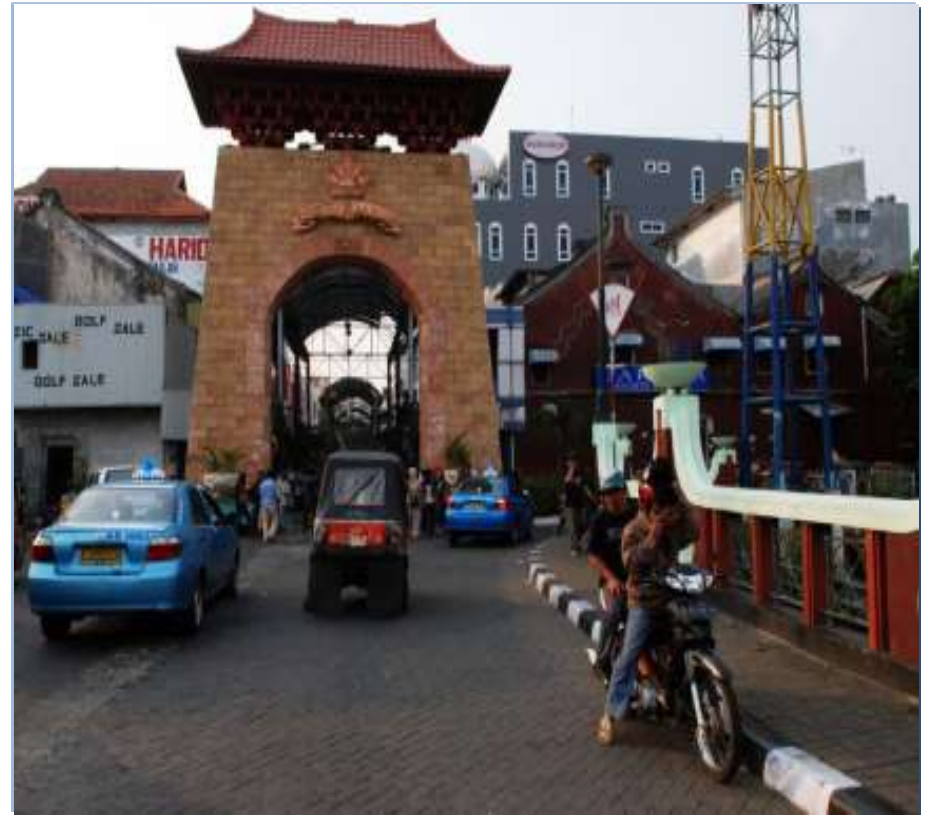
Kawasan Cagar budaya Passer Baroe, Jakarta