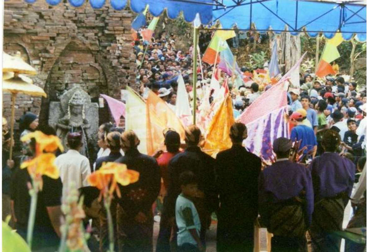
Kegiatan Upacara Adat dan Budaya Jawa Dusun Belahan Jowo CANDI BELAHAN