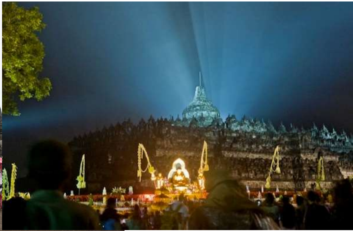
WAISAK UMAT BUDHA DI CANDI BOROBUDUR