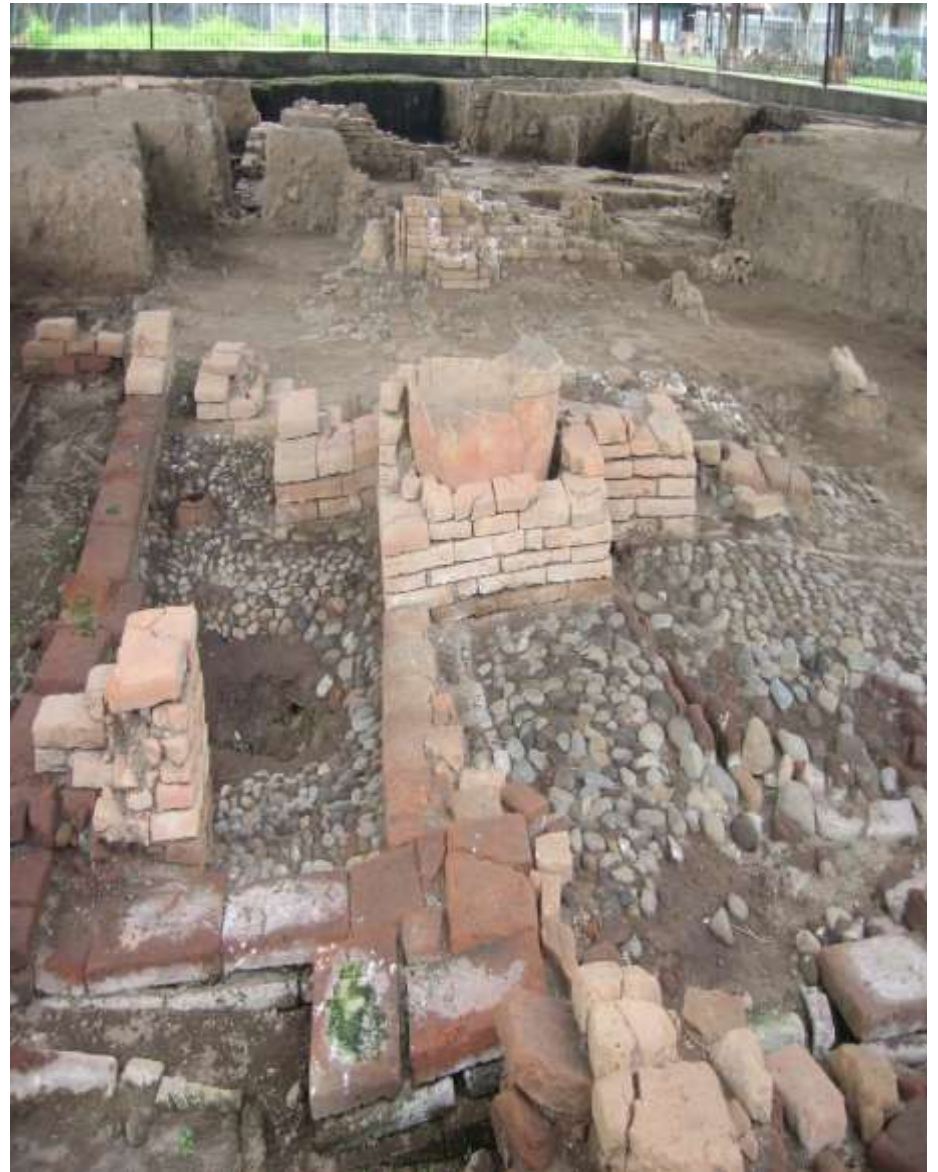
Struktur Pemukiman masa Majapahit di Museum Majapahit