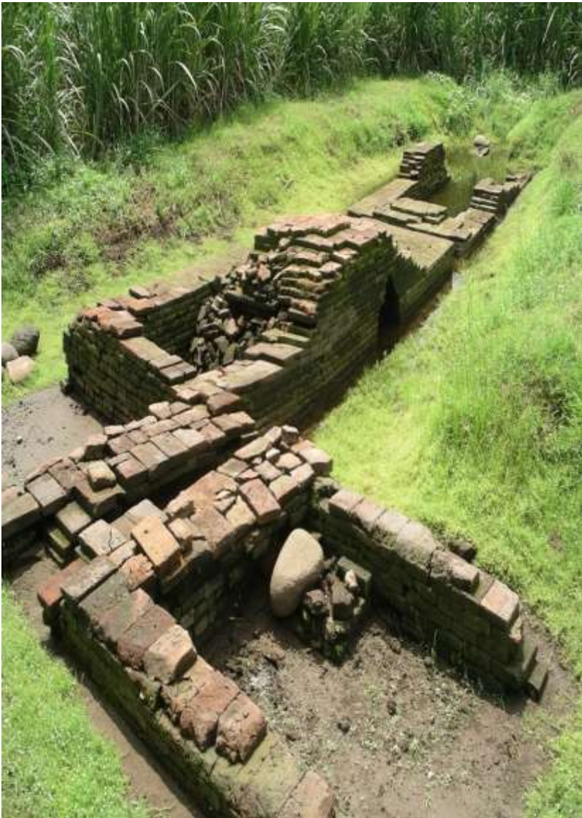
Struktur di dusun Tegalan, Kec. Trowulan