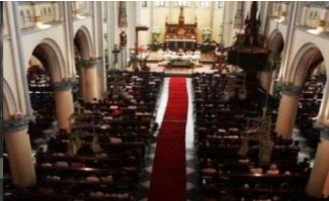
MISA UMAT NASRANI DI GEREJA KATEDRAL