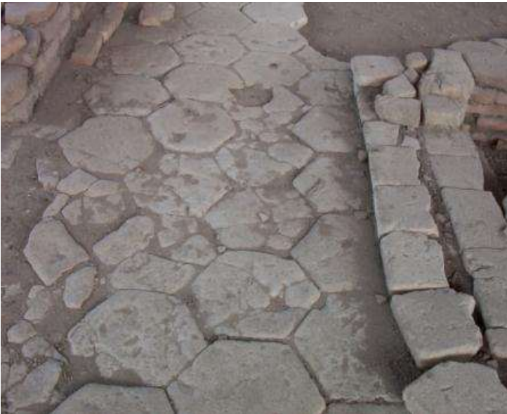
Struktur lantai kuno berbentuk segi enam di Trowulan

adalah susunan binaan yang terbuat dari benda alam dan/atau benda buatan manusia untuk memenuhi kebutuhan ruang kegiatan yang menyatu dengan alam, sarana, dan prasarana untuk menampung kebutuhan manusia