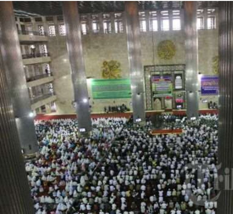
SHOLAT IED UMAT MUSLIM DI MESJID ISTIQLAL