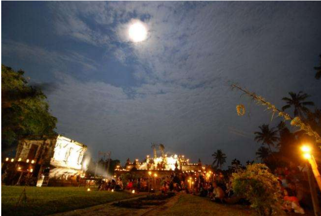
Kegiatan di candi penataran festival bulan purnama