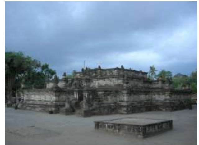
Kawasan Cagar budaya Candi Penataran