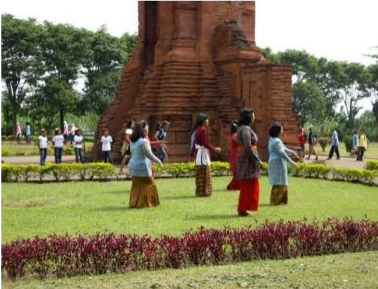
Gapura Bajangratu Trowulan Mojokerto Yang dimanfaatkan untuk kegiatan kesenian