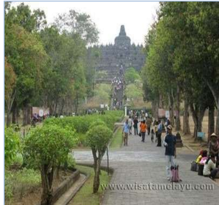
Kawasan Cagar Budaya Candi Borobudur