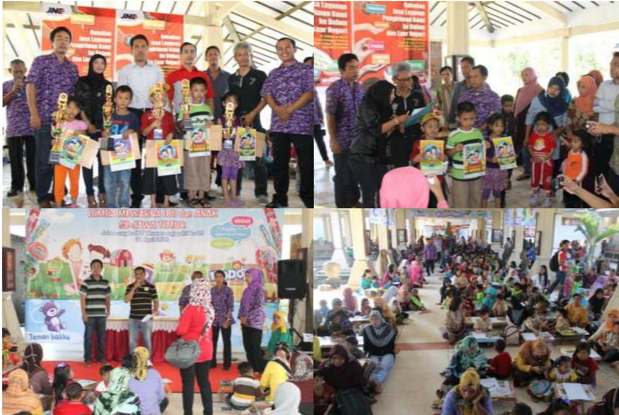
Kegiatan Lomba Mewarnai untuk Ibu dan Anak di Museum Majapahit