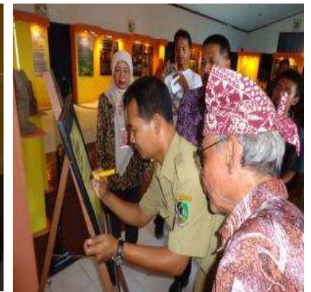
Pameran kepurbakalaan di Kabupaten Banyuwangi